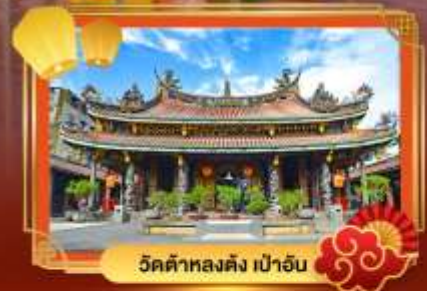
วัดต้าหลงตง เป่าอัน