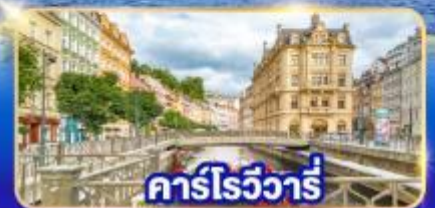
คาร์โรวัวร์