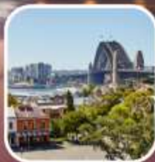
SYDNEY OBSERVATORY HILL