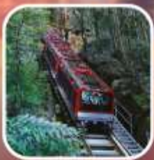
อุทยานบลูเมาท์เท็นส์