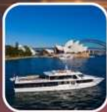
ล่องเรือชมอ่าวซิดนีย์