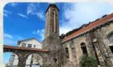
Tam Dao Stone Church