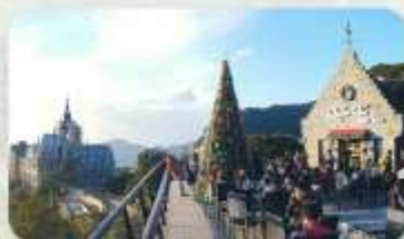
Gio Cafe Tam Dao