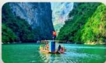
ล่องเรือ Ma Pi Leng Pass

YEN BIEN LUXURY 4* หรือเทียบเท่ามาตรฐานเวียดนาม