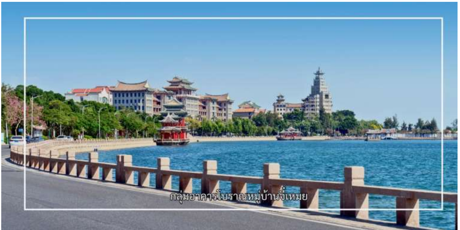
กลุ่มอาคารโบราณหมู่บ้านจีเหมย

จากนั้นนำท่านสู่ สระเรือมังกร (Dragon Boat Pond) เป็นแหล่งท่องเที่ยวทางวัฒนธรรมและภูมิทัศน์ที่มีชื่อเสียงของเมือง สระน้ำแห่งนี้สร้างขึ้นโดยมีจุดประสงค์เพื่อใช้จัดการแข่งขันเรือมังกร ซึ่งเป็นประเพณีสำคัญที่สะท้อนรากเหง้าทางวัฒนธรรมของชาวจีน โดยเฉพาะในช่วงเทศกาลตวนอู่ พื้นที่โดยรอบสระได้รับการออกแบบอย่างงดงาม รายล้อมด้วยอาคารสไตล์จีนดั้งเดิม สะพาน ทางเดิน และสวนสาธารณะ ทำให้เกิดบรรยากาศที่ผสมผสานระหว่างความสงบร่มรื่นและกลิ่นอายทางประวัติศาสตร์ สระเรือมังกรจีเหมย จึงเหมาะแก่การเดินชมทัศนียภาพ ถ่ายภาพ และเรียนรู้เรื่องราวทางวัฒนธรรมของเมืองเซียเหมินอย่างใกล้ชิด