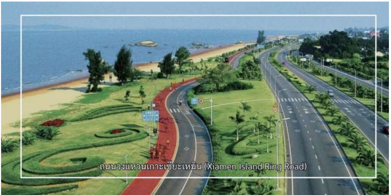
ถนนวงแหวนเกาะเซี่ยเหมิน (Xiamen Island Ring Road)

จากนั้นนำท่านอิสระช้อปปิ้ง ถนนคนเดินจงซาน (Zhongshan Road Walking Street) เป็นถนนสายการค้าที่มีชื่อเสียงและคึกคักที่สุดแห่งหนึ่งของเมืองเซี่ยเหมิน ถนนสายนี้เต็มไปด้วยร้านค้า ร้านอาหาร คาเฟ่ และแหล่งช้อปปิ้งหลากหลายรูปแบบ พร้อมสถาปัตยกรรมสไตล์จีนผสมตะวันตกที่เป็นเอกลักษณ์ สะท้อนถึงประวัติศาสตร์และความเจริญของเมืองในอดีต ท่านสามารถ เพลิดเพลินกับการเลือกซื้อสินค้า ลิ้มลองอาหารท้องถิ่นขึ้นชื่อ และเดินชมบรรยากาศย่านการค้าเก่าแก่ที่มีชีวิตชีวา ถนนคนเดินจงซานจึงเป็นจุดหมายสำคัญที่ผสมผสานทั้งการช้อปปิ้ง วัฒนธรรม และวิถีชีวิตของชาวเซี่ยเหมินไว้ได้อย่างลงตัว