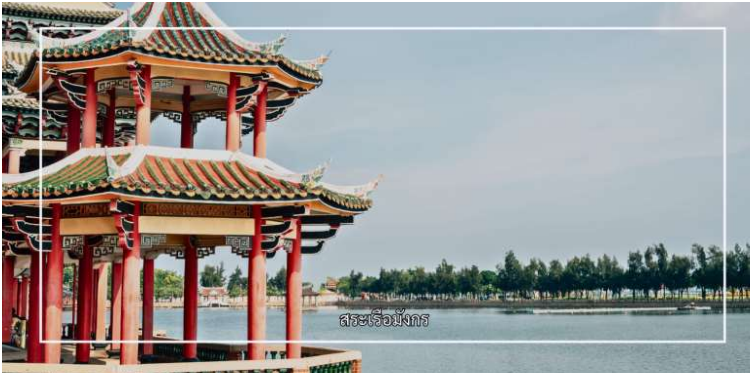
สระเรือมังกร

จากนั้นนำท่านสู่ สระเรือมังกร (Dragon Boat Pond) เป็นแหล่งท่องเที่ยวทางวัฒนธรรมและภูมิทัศน์ที่มีชื่อเสียงของเมือง สระน้ำแห่งนี้สร้างขึ้นโดยมีจุดประสงค์เพื่อใช้จัดการแข่งขันเรือมังกร ซึ่งเป็นประเพณีสำคัญที่สะท้อนรากเหง้าทางวัฒนธรรมของชาวจีน โดยเฉพาะในช่วงเทศกาลตวนอู่ พื้นที่โดยรอบสระได้รับการออกแบบอย่างงดงาม รายล้อมด้วยอาคารสไตล์จีนดั้งเดิม สะพาน ทางเดิน และสวนสาธารณะ ทำให้เกิดบรรยากาศที่ผสมผสานระหว่างความสงบร่มรื่นและกลิ่นอายทางประวัติศาสตร์ สระเรือมังกรจีเหมย จึงเหมาะแก่การเดินชมทัศนียภาพ ถ่ายภาพ และเรียนรู้เรื่องราวทางวัฒนธรรมของเมืองเซียเหมินอย่างใกล้ชิด