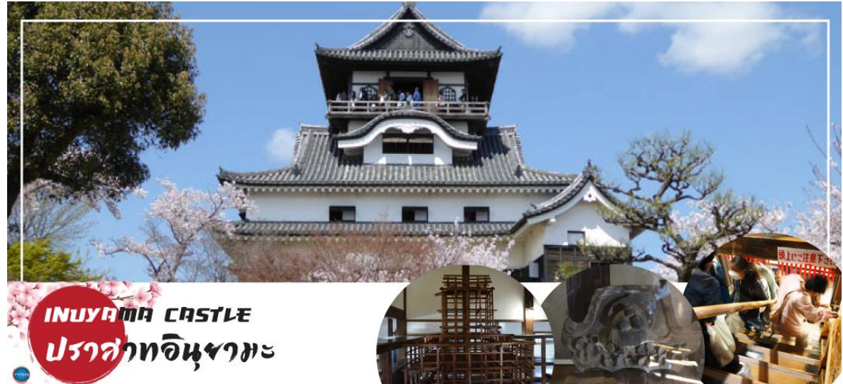
INUYAMA CASTLE ปราสาทอินยามะ

นำท่าน เข้าชม ปราสาทอินยามะ (Inuyama Castle) ตั้งอยู่ใจกลางเมืองอินยามะ ทางตะวันตกเฉียงเหนือของจังหวัดไอจิ ประเทศญี่ปุ่น เป็นปราสาทที่สร้างขึ้นในตอนปลายศตวรรษที่ 16 ที่อยู่รอดมาจนถึงปัจจุบัน ปราสาทแห่งนี้มีความพิเศษตรงที่มีหอคอยที่มีความเก่าแก่ที่สุดในประเทศ ดังนั้นปราสาทแห่งนี้จึงได้รับการประกาศให้เป็นสมบัติของชาติ ด้านในของปราสาทมีการจัดแสดงอาวุธในการทำสงครามในสมัยต่าง ๆ ของญี่ปุ่น และเราสามารถเดินขึ้นไปด้านบนเพื่อชมความงามของตัวเมืองอินยามะ ตลอดจนแม่น้ำคิโซะ และที่ราบโนบิได้