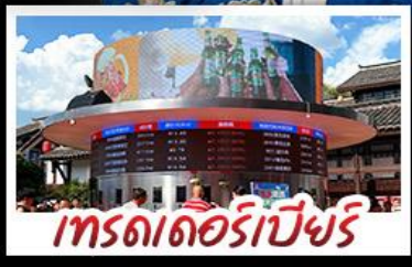
เกรตเตอร์เบียร์