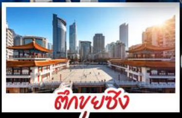
ตึกยูยชิ่ง