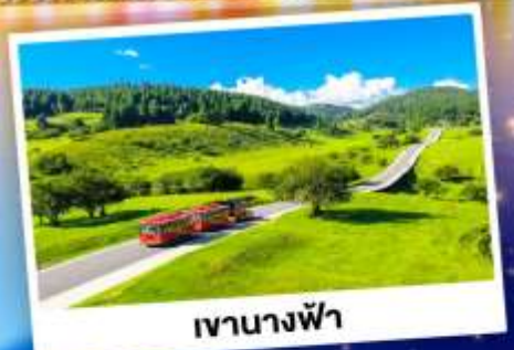
เจานางฟ้า