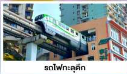
รถไฟฟ้าลู่ติ๊ก