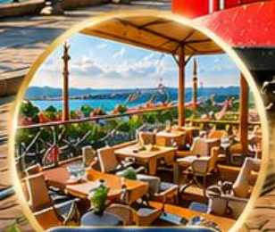
Seven Hills Cafe ชมวิว อิสตันบูล

HOLLYWOOD OF TROY บ้านไม้เมืองทรอย จำลอง