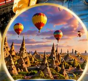
เมืองคัปปาโดเกีย Cappadocia