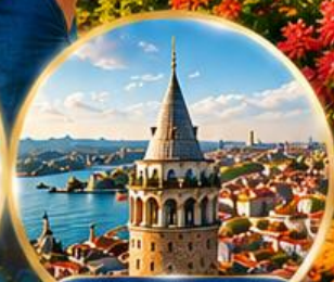
หอคอยกาลาตา Galata Tower