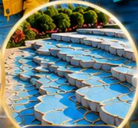
ปานุกคาล์ Pamukkale