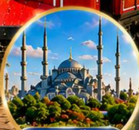
สุเหร่าสีน้ำเงิน Blue Mosque