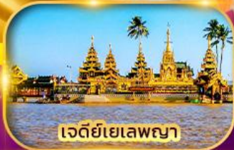
เจดีย์เยเลพญา