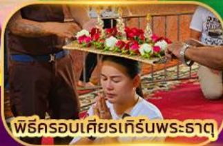
พิธีครอบเศียรเทิร์นพระธาตุ