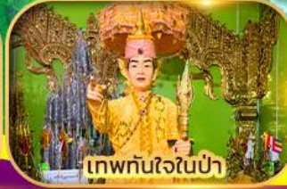
เทพทันใจในป่า