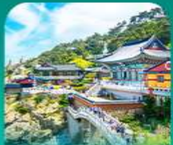
วัดแฮดงกุงซา

เที่ยวปูซานแบบแกรนด์ แกรนด์ ทั้งสายอาร์ท สายบู และสายช้อปปิ้ง • เขิกอินบนท่าฮุนสึคิลเลอร์ฟูล ที่ทำเรื่องจินบี (BUSAN BUNEZIA) เติบสมหมู่บ้านคิมชอน ซาซโดริแห่งปูซานสุดน่ารัก พลาดไม่ได้กับการนั่งรถไฟปูกัน ชมนิวทาว์นเมืองปูซาน • เสริมสิริมงคลที่วัดแฮดงกุงซา วัดริมทะเลชื่อดัง พร้อมช้อปปิ้งที่ลือชื่อคัฟรี่เนียมเจ้าก๊อ และตลาดบันโพคง ก่อนปิดท้ายด้วย ย่านวีอูร์นสุดชิค ซอ มยอง ออวี่ว พร้อมชมทิวสะพาน ควังอินยามค่าขึ้นสุดโรแมนติก