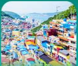
หมู่บ้านดัมชอน