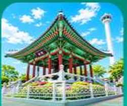
สวนเซงจูซาน