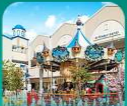
ลือตเต็ เอ้าท์เก็ต