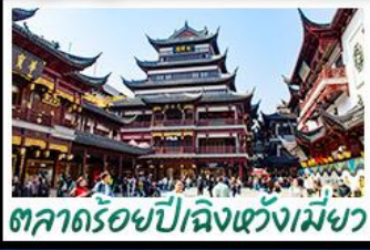
ตลาดร้อยปีเฉิงหวงเมี่ย