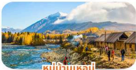
หมู่บ้านเหอมู่่