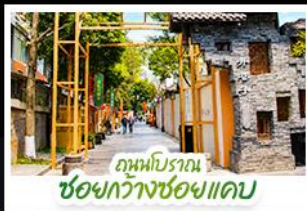
ถนนโบราณ ชอยกว้างชอยแคบ