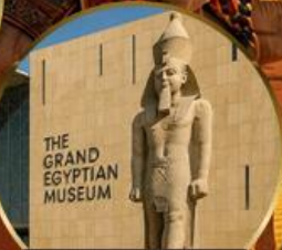
พิธีภัณฑ์แกรนด์อียิปต์