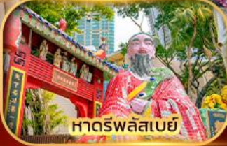
หาดร์พลัสเบย์