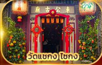
วัดเขกง ไชกง