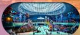
รวมค่าเข้าสวนสนุก Spaceship Park