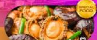
พิเศษเมนู หอยเป๋าฮื้อ เดินทาง มีนาคม 69