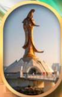
เจ้าแม่ทอมัสอิมรินทะเล