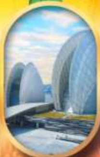
โรงละครโหลทัส