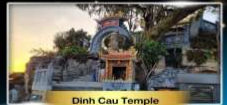
Dinh Cau Temple