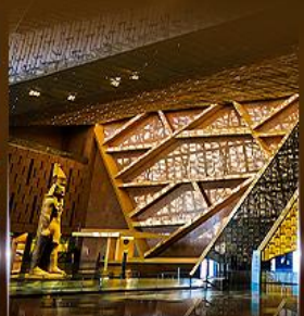
พิพิธภัณฑ์ไทรนิตี้อียิปต์ (GEM)