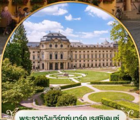
พระราชวังแวร์ซายส์ฝรั่งเศส