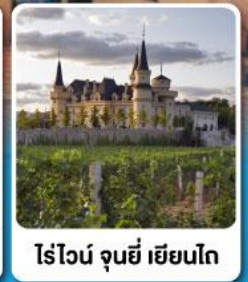
ไรไวน์ จุนยี่ เยียนไก