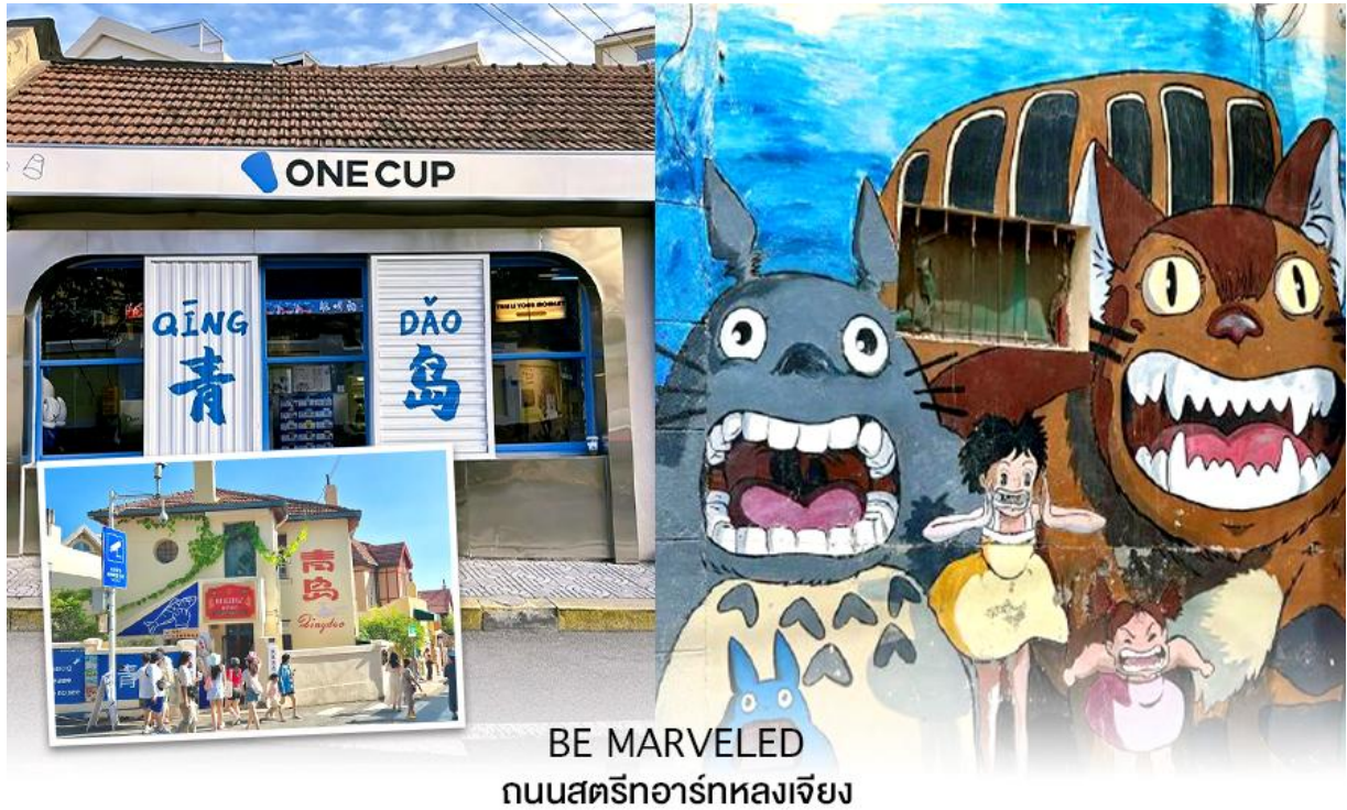
BE MARVELED ถนนสตรีอาร์ทหลงเจียง

จากนั้นนำท่านไปชม ทุ่งดอกฟิงค์มอส เป็นสวนดอกไม้ขนาดใหญ่ ในช่วงฤดูใบไม้ผลิทุ่งหญ้าจะปกคลุมไปด้วยดอกฟิงค์มอส ลักษณะของดอกฟิงค์มอสคล้ายดอกซากุระแต่บานบนพื้นดิน ออกดอกหนาแน่นสีชมพู ขาว และม่วง เป็นดอกไม้พุ่มเตี้ย ดอกขนาดเล็ก จะบานสะพรั่งเป็นพรมดอกไม้ เหมาะสำหรับการเดินเล่น ชมดอกไม้ ถ่ายรูป