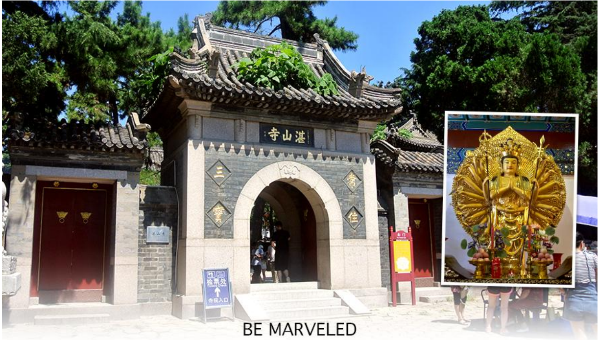
BE MARVELED วัดจันซาน

เมืองชิงเต่า สถานที่ที่สงบ และบรรยากาศภายในวัดที่ร่มรื่น ตั้งอยู่เหนือเนินเขาจากสวนสาธารณะ จงซาน ก่อตั้งในปี พ.ศ. 2477 เป็นวัดอายุน้อยที่สุดในนิกายเถียนโถของพุทธศาสนาจีน แต่โดดเด่น ด้วยสถาปัตยกรรมและคุณค่าทางวัฒนธรรม