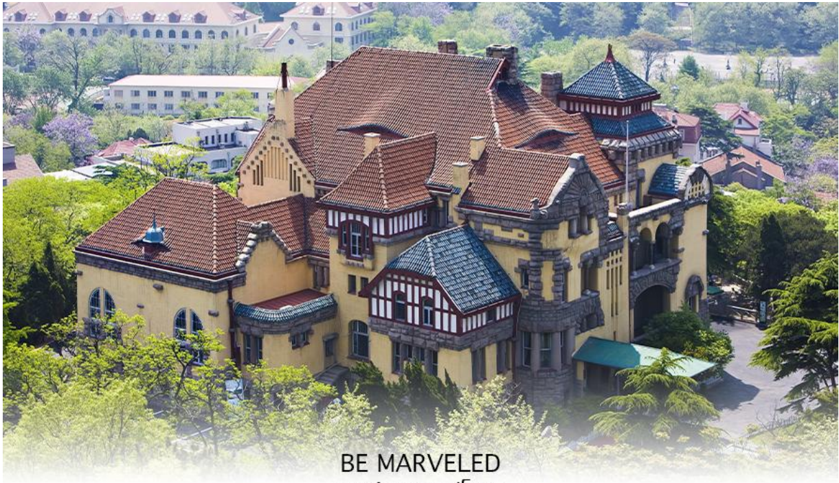
BE MARVELED พระตำหนักกรังวูโหลว