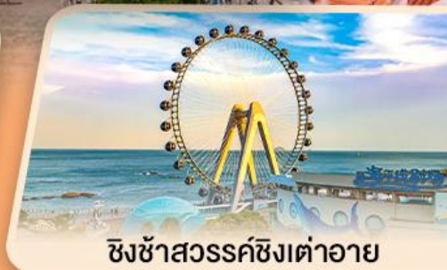
ชิงซ่าสวรรค์ชิงต้าอายุ