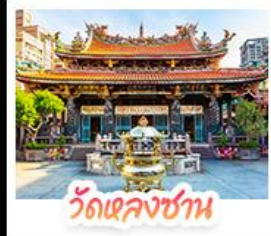
วัดเจหลงชาน