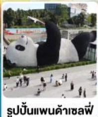
รูปปั้นแพนด้าเซลฟ์