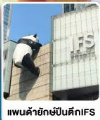
แพนด้ายักษ์ป็นตึกIFS