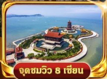
จุดชมวิว 8 เซียน