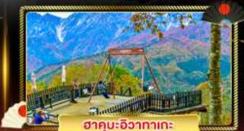
ฮาคุบะ-อิซากาตะ