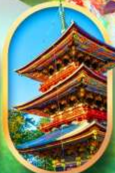
วัดนาริตะ-ซัง