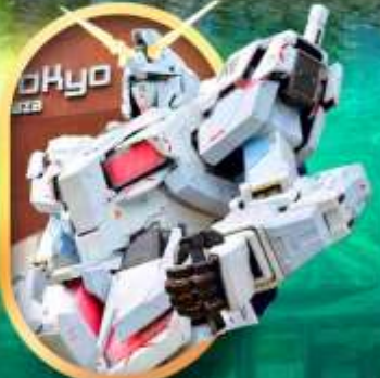
ห้างโอโดบะกินคัม