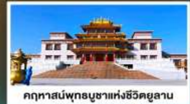
คฤหาสน์พุทธบูชาแห่งชีวีคยูลาน