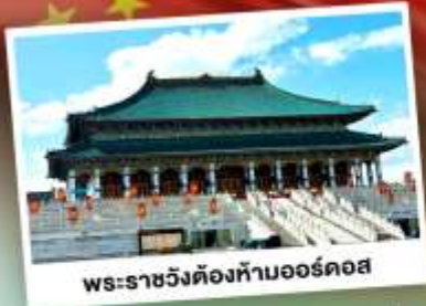
พระราชวังต้องห้ามออร์ดอส

ตะลุยนับร้อยร้องเพลง เหน่งมองโกเลียใน ชมวิวกุ้งหญ้าโล่งกว้างตัดขอบฟ้าคราม