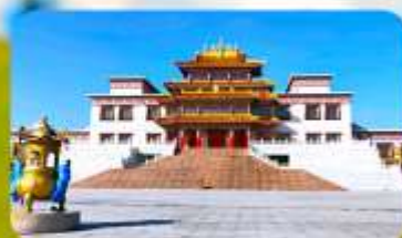
คฤหาสน์พุทธบูชาแห่งชีวิคยูลาน