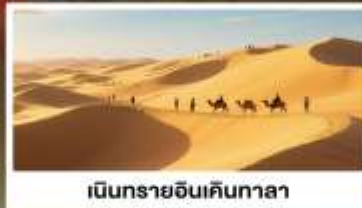
เนินทรายอินเกินทาลา