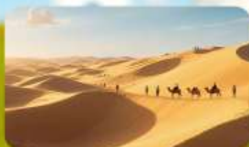
เนินทรายอินเคินทาลา