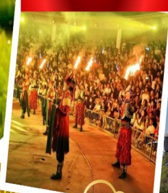
ปาร์ตี้รอบกองไฟ