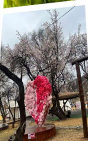
สวนแอปเปิ้ลคอก