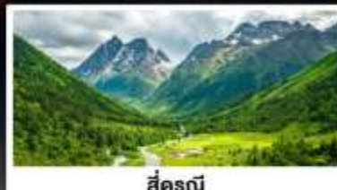
สี่ครุณี