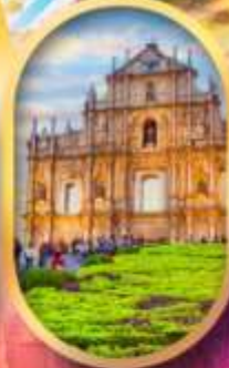
โบสถ์เซนต์พอล