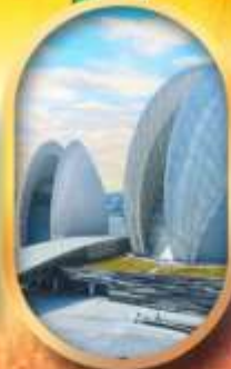
โรงละครโขนุก