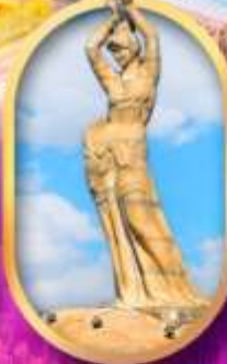
เด็กหญิงชาวประมง