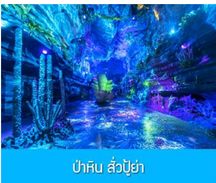
ป่าหิน ลั่วปู้ย่า

รับประทานอาหารเช้า ณ ห้องอาหารของโรงแรม (10)