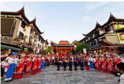
เมืองเทพธิดา

หลังอาหารนำท่านเดินทางโดยรถบัสสู่ เมืองเินซือ 恩施 (ระยะทาง 236 กม. ใช้เวลาเดินทางราวผ่านถนนซูเปอร์ไฮเวย์ประมาณ 3 ชั่วโมง)