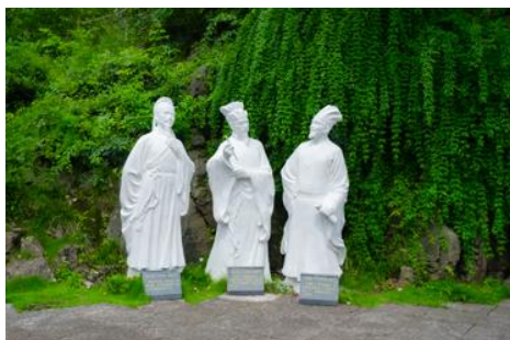
สวนเก้าสามสหาย