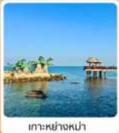
เกาะหย่างหม่า