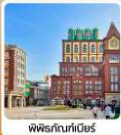
พิพิธภัณฑ์เบียร์