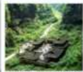
หุบเขาไฟสพานสวรรค์