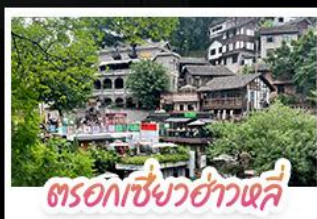
ตรอกเซียวฮ่าวเฉี