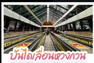
บันไดเลื่อนแขวงกวาน