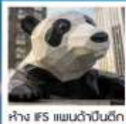
ห้าง IFS แพนด้าปิ่นตึก