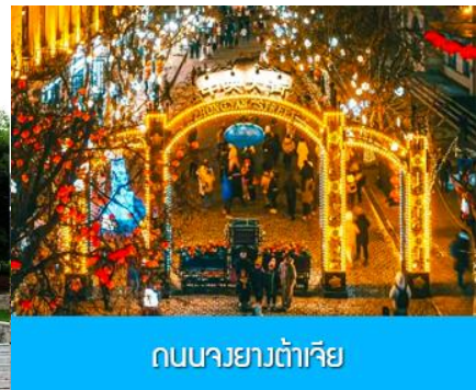
ถนนจงยั้งลู่