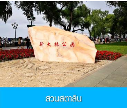
สวนสตาลิน