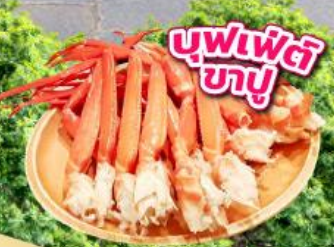
บุฟเฟ่ต์ ซาซุ