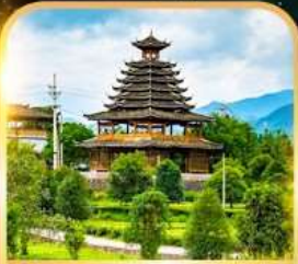
หมู่บ้านชนเผ่าตัง