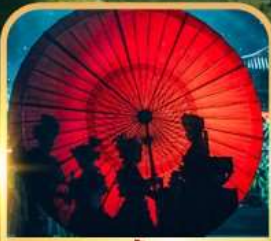
ชมแสงสีท่าเกิ่งหลง