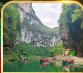
อุทยานจินหลี่ชาน