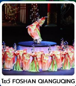
โชว์ FOSHAN QIANGUQING