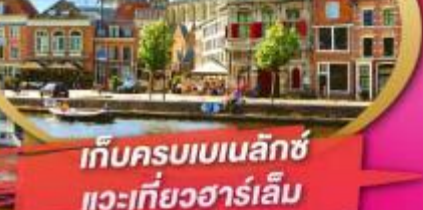
เก็บครบเบนเนลักซ์ แวะเที่ยวฮาร์เล็ม