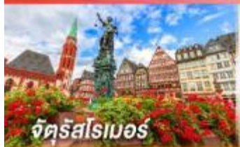
จัตุรัสโรเมอร์