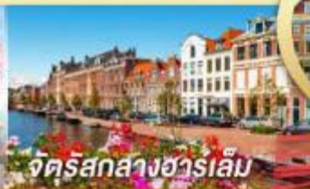
จัตุรัสกลางฮาร์เล็ม