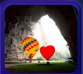
“ ถ้าถึงหลง ”