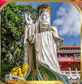
เจ้าแม่กวนอิม พลัสเบย์