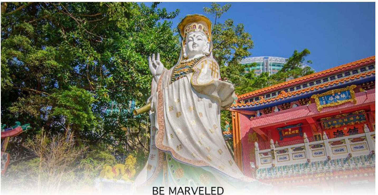
BE MARVELED วัดเจ้าแม่กวนอิมรีพลัสเบย์

จากนั้นนำท่านเดินทางสู่ ชายหาดรีพลัส เบย์ (REPULSE BAY) หาดทรายรูปจันทร์เสี้ยวแห่งนี้เป็นหาดที่สวยงามที่สุดแห่งหนึ่งในฮ่องกง และยังใช้เป็นฉากในการถ่ายทำภาพยนตร์หลายเรื่อง ถือเป็นแหล่งท่องเที่ยวยอดนิยมในหมู่ชาวฮ่องกงนักท่องเที่ยวนิยมมาสักการะที่ วัดทินฮั่ว อารีพลัสเบย์ (TIN HAU TEMPLE REPULSE BAY) ซึ่งตั้งอยู่ริมทะเล เป็นสถานที่ท่องเที่ยวสำคัญ สร้างขึ้นในปี ค.ศ.1993 มีรูปปั้นของ เจ้าแม่กวนอิม ปางประทานพรตั้งอยู่ ซึ่งคนฮ่องกงและคนจีนให้ความเคารพนับถือมากที่สุด เชื่อว่าเป็นเทพที่มีความศักดิ์มากขอพรเรื่องงานการเงิน และขอพรขอโชคลาภเพื่อเป็นสิริมงคลและขอพร