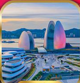
Zuhai Opera House