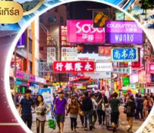
Shopping Tsim Sha Tsui