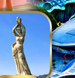
จูไห่ฟิชชอร์ทิวรา