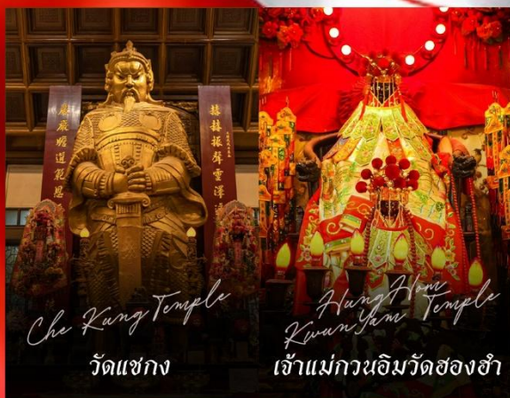
Che Kung Temple วัดแซกง

รายการทัวร์ข้างต้นอาจมีการปรับเปลี่ยนเพื่อความเหมาะสม