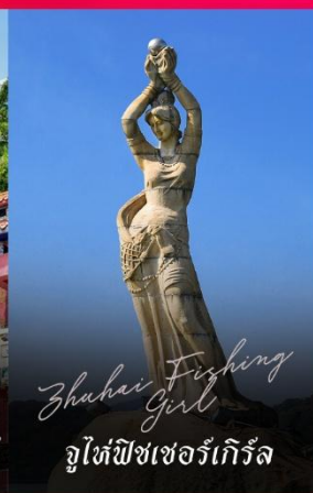
Zhuhai Fishing Girl จูไห่ฟิชเชอร์เก็ท