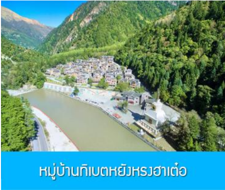
หมู่บ้านทิเบตหยิงหวงฮาเต๋อ

รับประทานอาหารกลางวัน ณ ร้านอาหารพื้นเมือง (8)