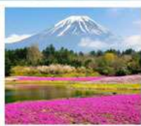
ทะเลสาบโมโตสุ ทุ่งพืชมอส