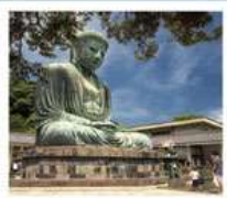
วัดโศโตคุอิน

SHIRAKAWAGO JAPAN ALPS MATSUMOTO KAMIKOCHI FUJI KAMAKURA