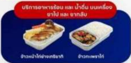
บริการอาหารร้อน และ น้ำดื่ม บนเครื่อง ยาไป และ ขากลับ