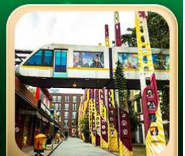
“ตงเจียวจื่อ”