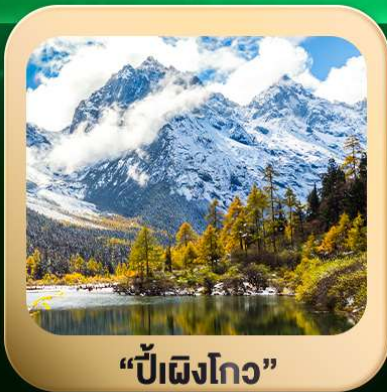
“ปี่ผิงโกว”

ชมธรรมชาติ 2 อุทยานขึ้นชื่อ อุทยานภูเขาสี่ดรุณี + อุทยานปี่ผิงโกว สะพานหนานเฉียว • ถนนคนเดินไท่กู่หลี่ + ซุนซีลู่ + Pop Mart • ตงเจียวจื่อ