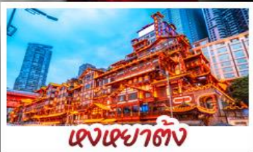
เจงเฉาตัง