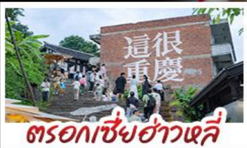
ตรอกเซี่ยฮ่าวหลี่