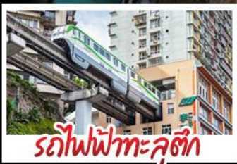
รถไฟไฟทะเลลู่ติ๊ก