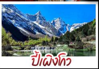
ปี้เฉิงโกว