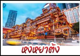
เฉิงเฉิงเฉิง