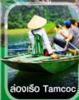
ล่องเรือ Tamcoc

✈️ คอนเฟิร์มออกเดินทาง ✈️ ทุกพีเรียด 2 ท่านขึ้นไป